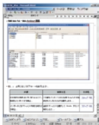
1. 統一されたレイアウトのドキュメントをすばやく作成