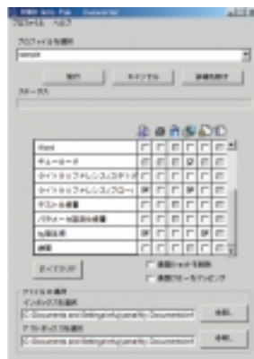
2. 複数のドキュメントを必要な形式に一括変換 (複数ファイルを選択しての一括印刷も可能)